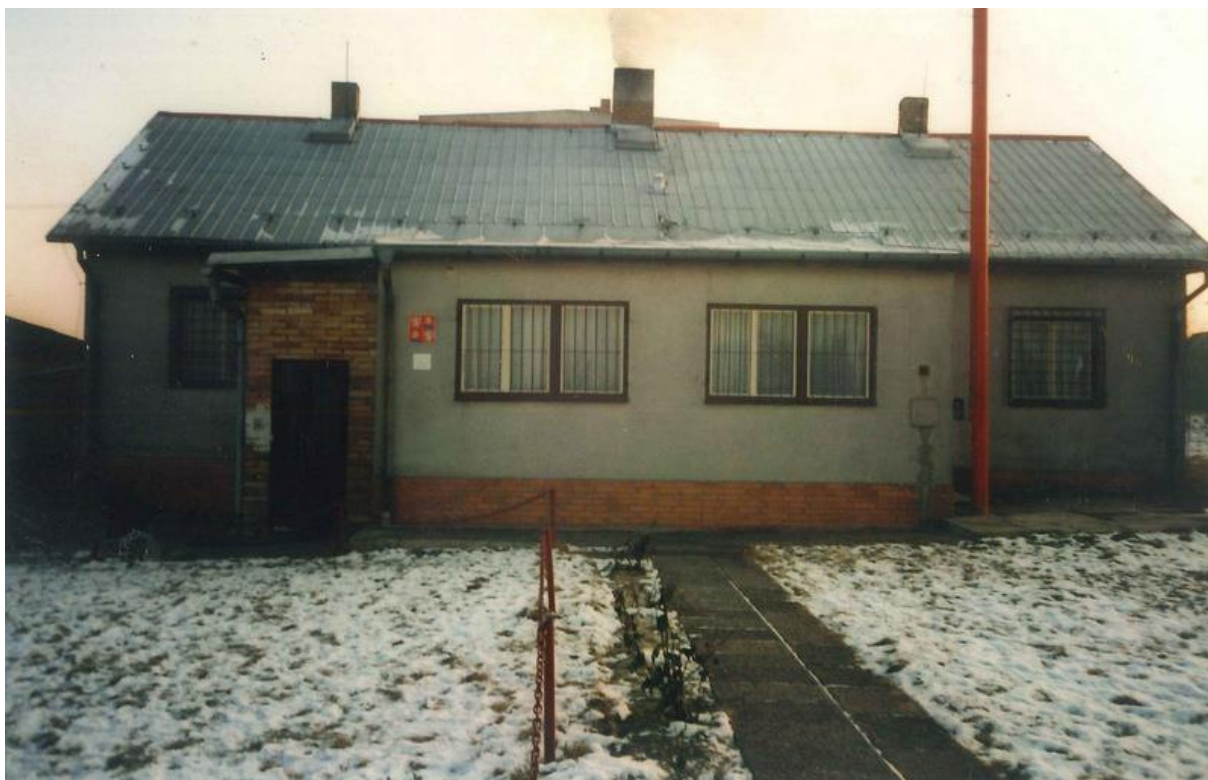
Stará budova Stanice pohraniční policie Dolní Dvořiště rok 1995.

Všichni policisté již absolvovali rekvalifikační kurz v Důstojnické a praporčické škole FMV v Holešově. Od září nastupovali dva policisté do základního kurzu psodů do školícího zařízení v Libějovicích, další dva ještě tímto kurzem měli projít.