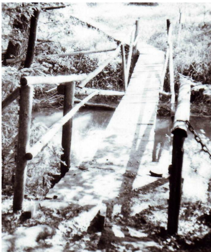
Můstek a hatě přes řeku Malši u HM III/33 vybudovali policisté OPP D. Dvořiště. Foto rok 2000.

V těsné blízkosti státní hranice najde současný návštěvník ještě tu a tam zbytky hatí, dřevěných chodníků přes vodní toky, bažiny a močáliska zhotovované pohraničníky k tomu, aby mohli procházet kolem státní hranice, provádět její demarkaci nebo jen běžné pochůzky. Za dob Pohraniční stráže prováděli jejich výstavbu ženisté a technické hlídky. V devadesátých letech prováděli jejich zbudování a opravu sami policisté, většinou v rámci tzv. pracovních rehabilitací. Jednalo se vlastně o zvláštní druh dovolené, kdy policista první týden manuálně pracoval na údržbě zařízení MV a druhý týden měl normální dovolenou. V rámci těchto pracovních rehabilitací jsme vybudovali a opravili desítky metrů hatí. Lesáci, se kterými jsme se vždy domluvili, byli rádi, vždyť tyto chodníky sloužili všem a k výstavbě se používalo dřevo z náletu nebo jej lesník určil jako prořezávku.