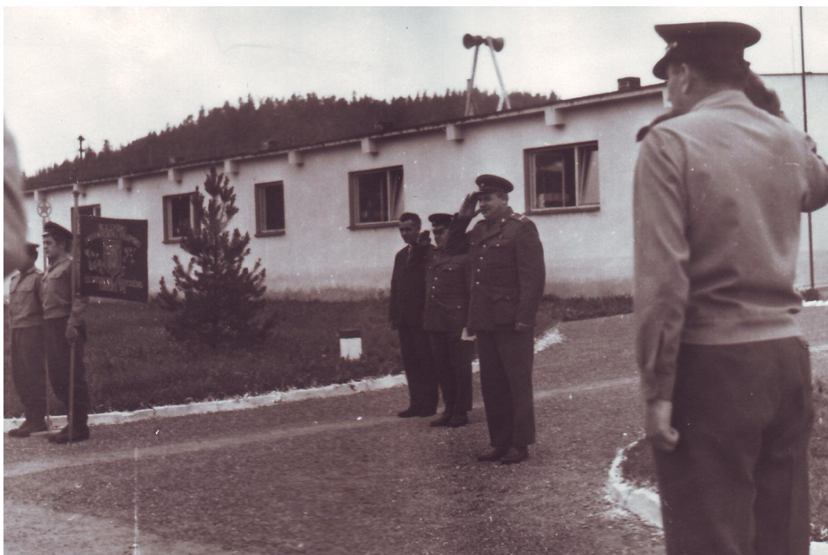
V roce 1966 získala rPS Mlýnce potřetí titul „Vzorná rota.“

V roce 1966 začala přestavba celého úseku signalizace U-60. Starou trasu v levé části nahradila nová trasa od Stegmühle podél potoka kolem roty a dál směrem na Studánky. Došlo i k postavení nových pozorovaten a tím se zvětšila vzdálenost od drátěného zátarasu k státní hranici a taky větší prostor k úspěšnému zadržení narušitelů pohraničními hlídkami.